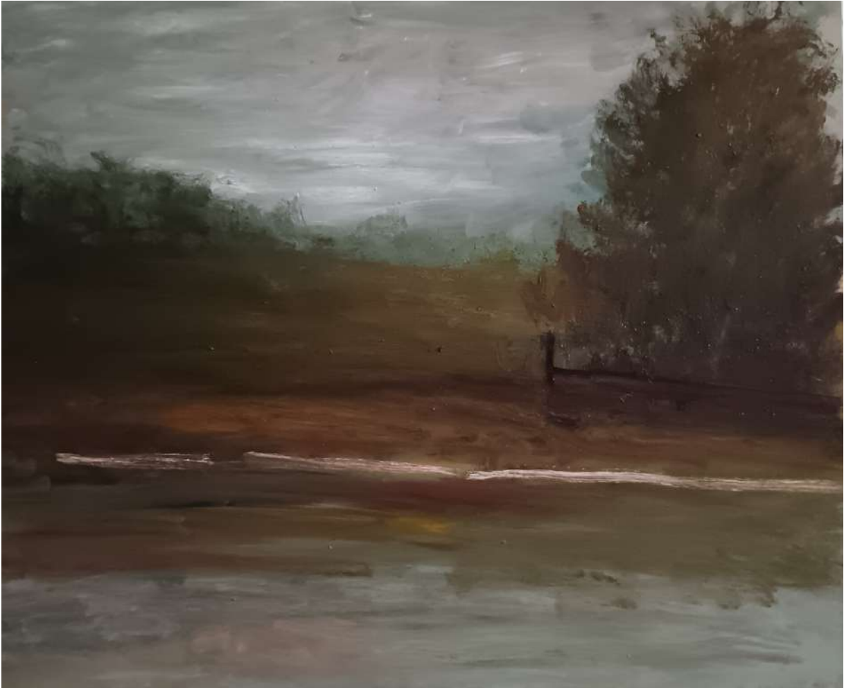
Marine Joatton, le bois de Claire, huile sur bois, 54x66cm