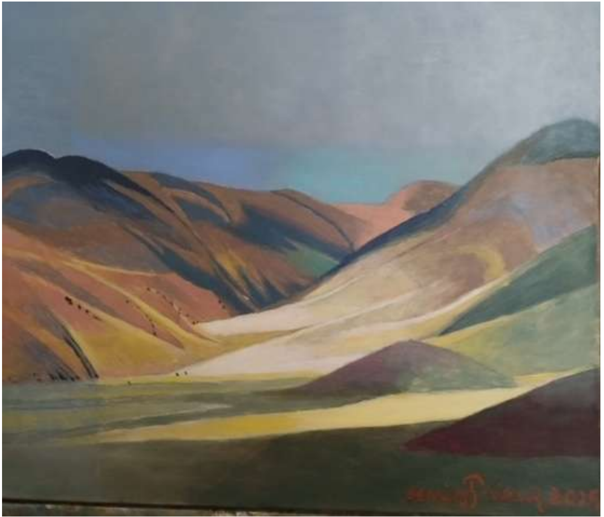
Denis Prieur, Les Collines, Tempera, encaustique et huile sur toile, 2025