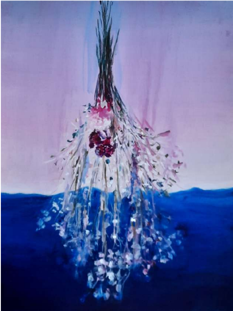
Clément Montolio, Sans titre, 2025, 61x 46cm Acrylique sur toile.