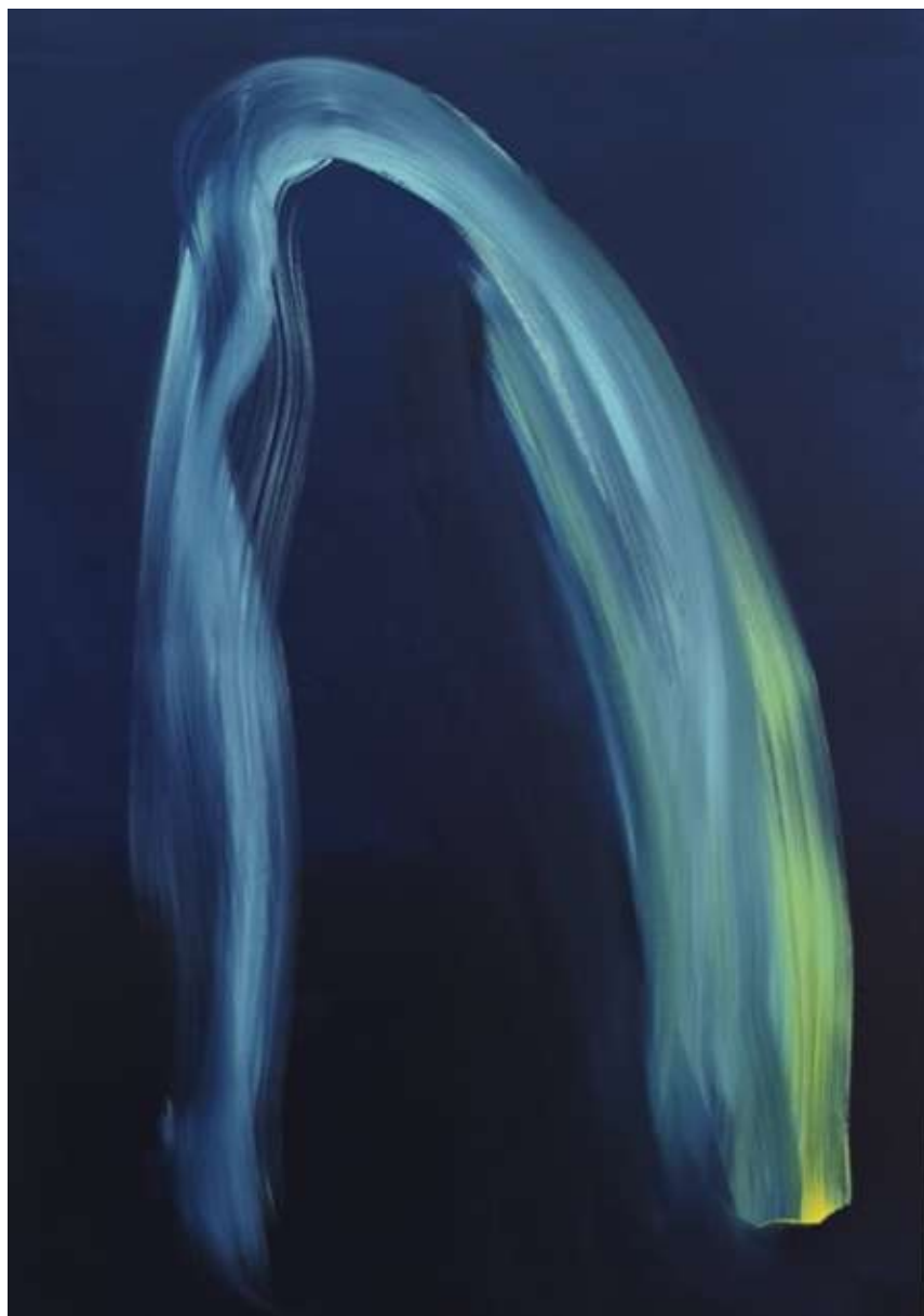
Laure Cambie, Sans titre 2025 Acrylique et pigments sur toile, 120x85cm