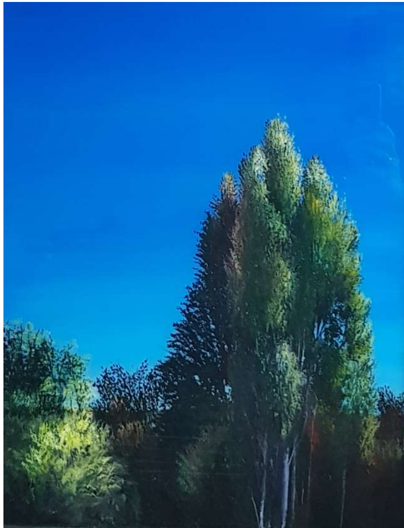
Geneviève Garcia Gallo, sans titre, huile, fixé sous verre