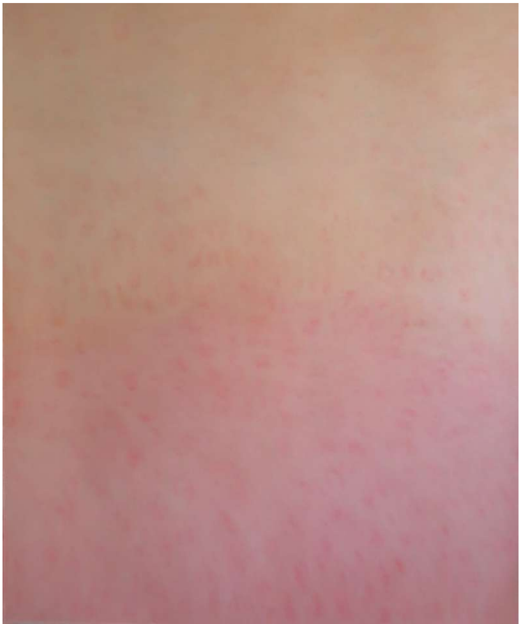
Claire Borde, huile sur toile, 162x130cm, 2025