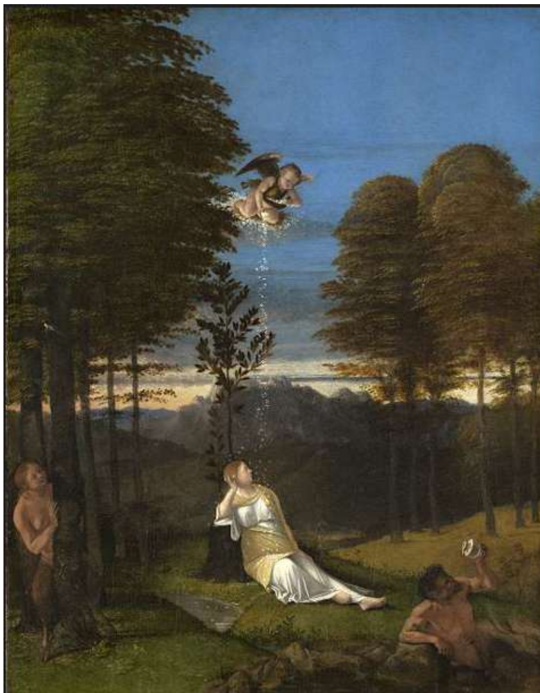
© image : Le songe de la jeune fille ou allégorie de la chasteté, Lorenzo Lotto, 1505, Collection National Gallery of Art, Washington

Vers 1505, le peintre Lorenzo Lotto réalise une œuvre intitulée Le songe de la jeune fille ou allégorie de la chasteté . Sur le bleu du ciel, à l'aplomb d'une jeune fille assise dans l'herbe un amour ailé répand des fleurs blanches presque transparentes.